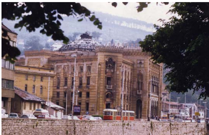
2. Sarajeve. Bibloteka Kombetare dhe Universitare.

Gjithashtu, do të jete e veshtire të pershkruehen perceptimet e ndjera nga kush ka patur mundesine të vizitoje kishat shume të pasura serbo-ortodoske, të vandalizuara, të marra flake dhe/ose të minuara nga ekstremistet kosovare-shqiptare ose të riprodhoje ngjyrat, dritehijet ose kryeveprat e vecanta të gjenise njerezore, si Adhurimi i barinjve me Shenjtet Francesco e Lorenzo të Karavaxhos, të cilat asnje riprodhim fotografik o digjital mund t'u nxjerre ne pah saktesisht meritat.