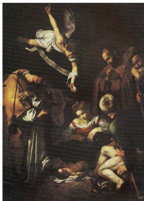
4. Caravaggio, Adhurimi i pastoreve me Shenjtet Francesk dhe Lorenc.