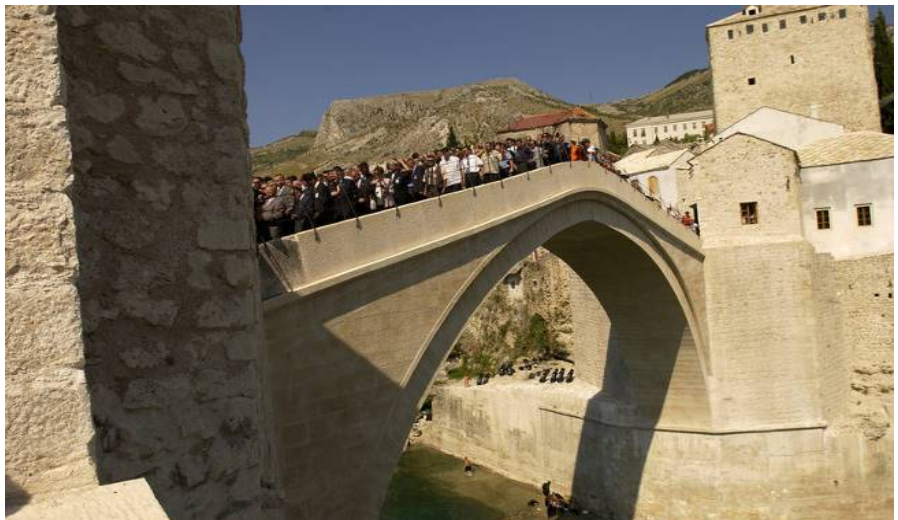
1. Stari Most e rindertuar pas bombardimeve te vitit 1993.

Nuk mendoj se eshte e mundur t’u transmetohen brezave te ardhshem keto ndjenja te tmerit, te paqartesis dhe te